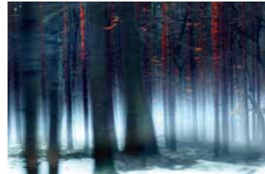
Sabine Wenzel Wald bei Rabenstein 2006 Inkjetprint auf Leinwand 85 x 128 cm