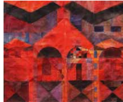
Ruth Tesmar Wald II 2011 Aquarell auf altem Bütten-Buchbogen 36 x 42,5 cm